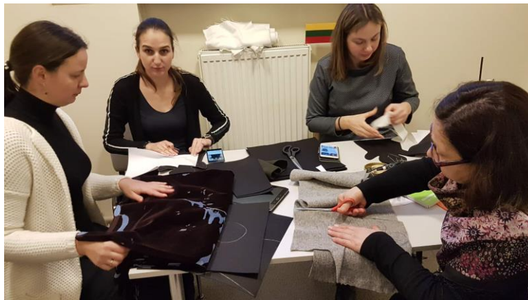
Mokymai „Manyje yra daugiau“

Aktyvios mamytės iš Šiaulių l/d Berželis. Tema – „Lėlių siuvimas darželio vaidinimams“